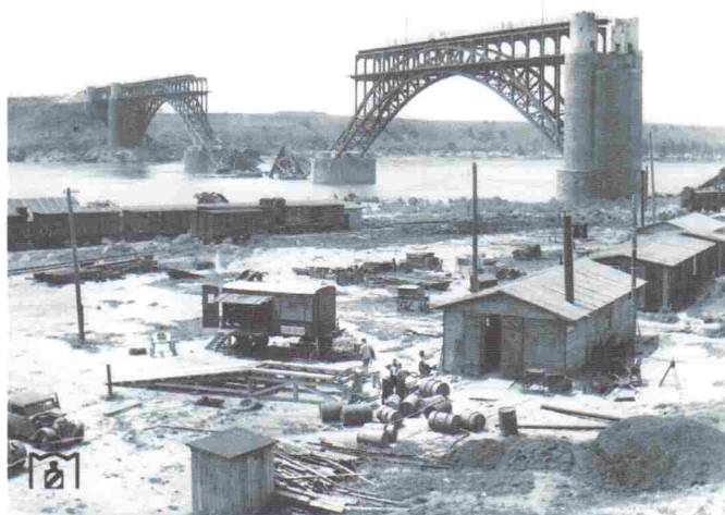
Оккупированное Запорожье. Восстановление оккупантами разрушенного в ходе военных действий моста им. Стрелецкого через р. Днепр. Фото: август 1941 г.

Враг воспользовался этим, просочился на левый берег и занял плацдарм в районе парка Metallургов. Однако подразделения 247-й стрелковой дивизии окружили неприятеля и полностью очистили левый берег Днепра. Но противник еще находился на острове Хортица. Положение было критическим. С острова он обстреливал весь город. Наше командование приняло решение очистить остров Хортицу от неприятелей. Ночью 3-го сентября началось форсирование Днепра на широком фронте в районе Дубовой рощи.